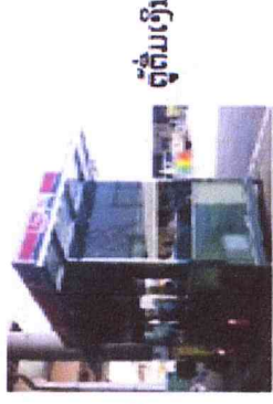
ຕູ້ຕົ້ມເງິນ